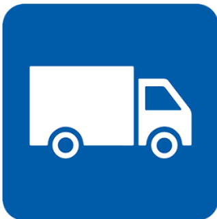
ምግብ እና መድኃኒት እርስዎ ያሉበት ቦታ ድረስ እንዲመጣልዎ ያድርጉ።