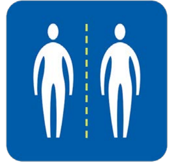
ከሰዎች ጋር ቅርብ ንክኪን ያስወግዱ።