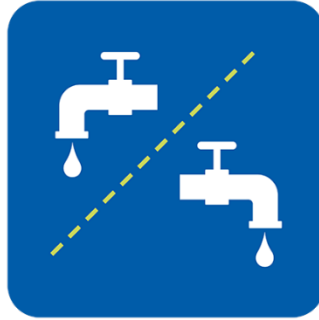
የተለያዩ አገልግሎቶችን ይጠቀሙ፣ ወይም ከተጠቀሙ በኋላ ያጽዱ።