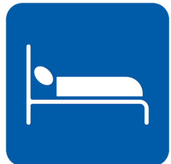
ከተቻለ ለብቻዎ ይተኙ