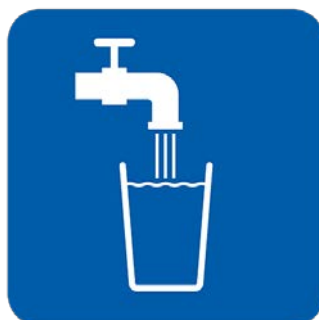
ብዙ ውሃ ይጠጡ