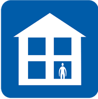
ወደ ሥራ፣ ትምህርት ቤት፣ GP ቀዶ ጥገና፣ ፋርማሲ ወይም ሆስፒታል አይሂዱ።