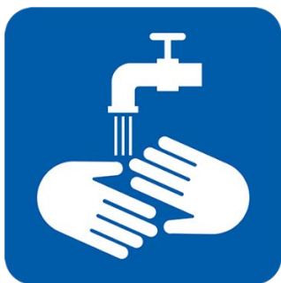
እጅዎን በየጊዜው ይታጠቡ